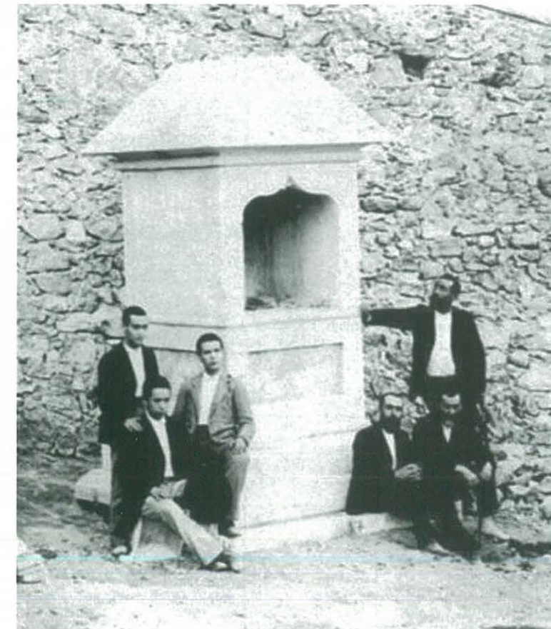
Capella del Calvari d'Ulldecona, principis de 1.900