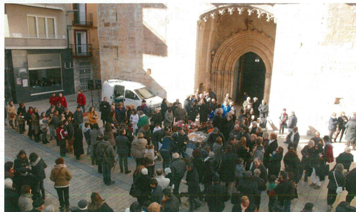
Festivitat de Sant Antoni

BIBLIOTECA POPULAR EDIFICI CASA DE CULTURA 43550 ULLDECONA (TARRAGONA)