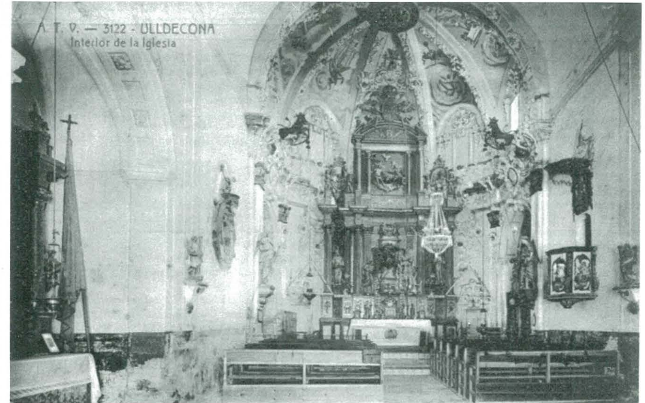
Ermita de la Pietat, 1912